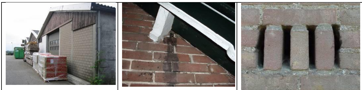
Figuur: voorbeelden van uitvliegopeningen van vleermuizen